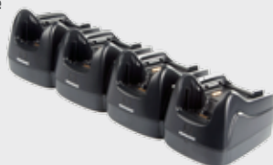
• 94A150037 Vierfach Lade-/Übertragungsstation • 94A150038 Vierfach Ethernet Station