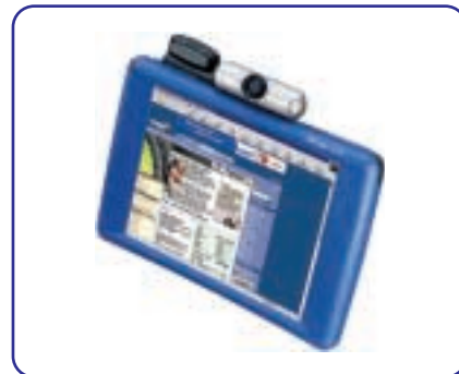
skeye.pad SL mit Webcam und Wireless-LAN-Karte