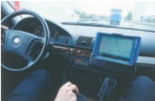
skeye.pad in der Kfz-Halterung

*Alle Varianten auch als „Pro“ erhältlich (HPC 2000 inkl. Pocket Office und Terminal Server Client)