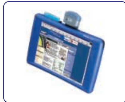
skeye.pad SL mit Scanner und Bluetooth-Karte