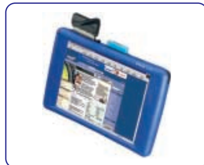
skeye.pad SL mit GPRS